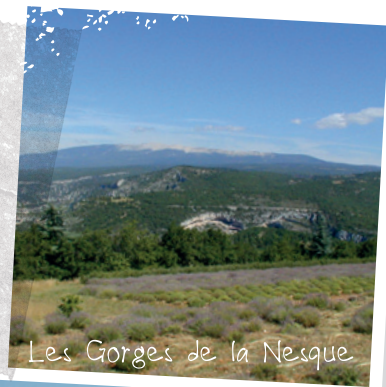
Les Gorges de la Nesque