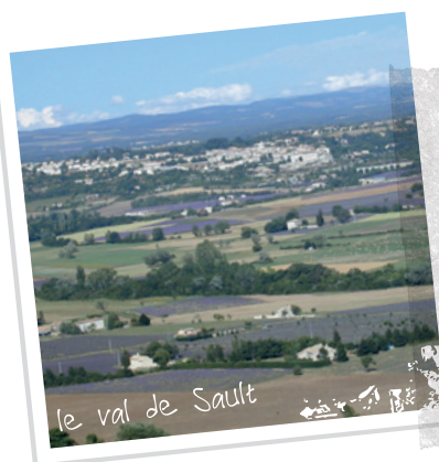
le val de Sault