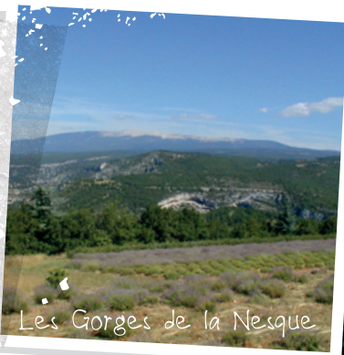
Les Gorges de la Nesque