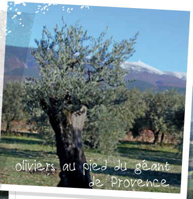
oliviers au pied du géant de Provence