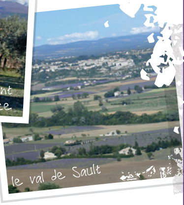
le val de Sault