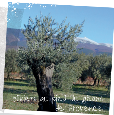
oliviers au pied du géant de Provence