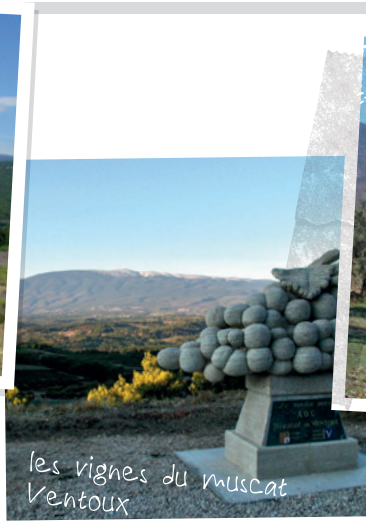
les vignes du muscat Ventoux