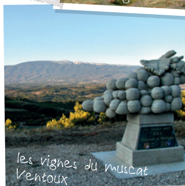
les vignes du muscat Ventoux